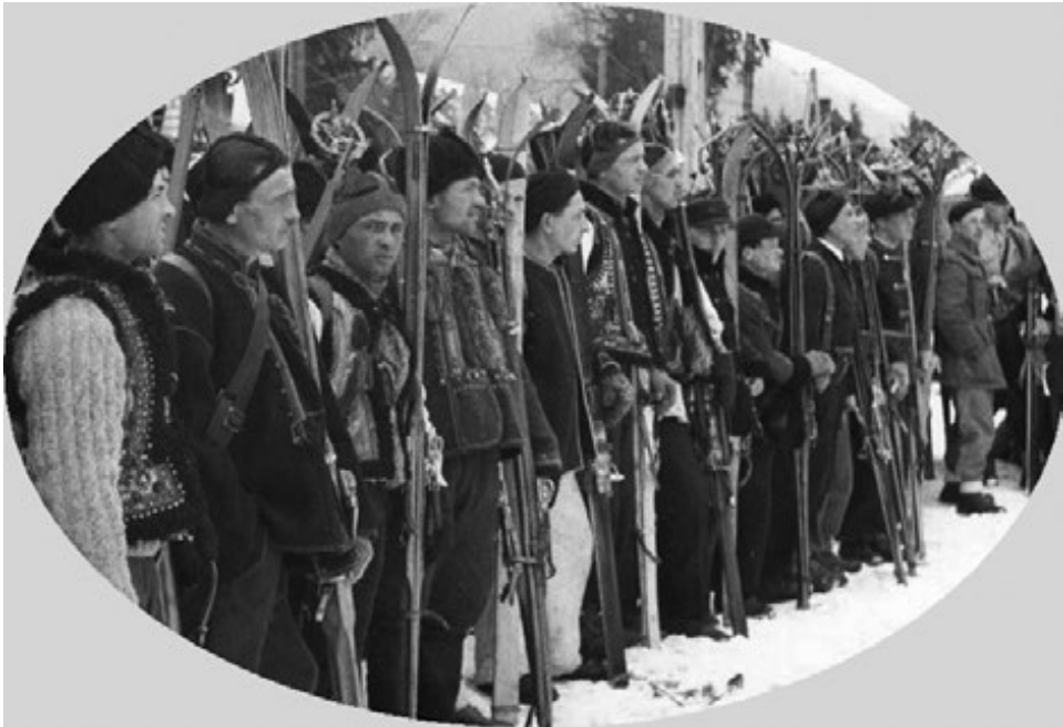
Ryc. 4. Huculscy narciarze. Fig. 4. Hutsul skiers.