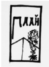
Odnaka UKTT „Płaj” z 1924 r.

Wykonana w białym metalu metodą płytkiego bicia, bez emalii, ma prostą i czytelną symbolikę. W centralnej części rozpościera się dwuspadowy namiot-pałatka, po prawej stronie płonie góralska watra (ognisko). W tle namiotu widnieje maszt z powiewającą „flagą”, którą tworzy stylizowany napis cyrylicą „Плай”. Zapięcie na szpilkę, możliwe też było na zakrętkę (Motyka 2002).