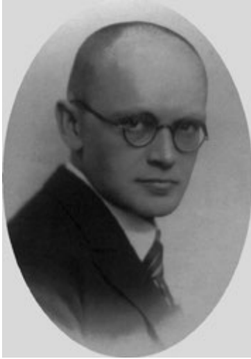
Ryc. 2. Wołodimir Kubijowycz. Fig. 2. Volodymyr Kubijovych.

Wschodnich badania. Przykładowo wymienię tutaj działalność Wołodymira Kubijowycza (Kubijowicz 1922, 1926, 1929, 1938; Kubijovič 1932, 1935, 1937).