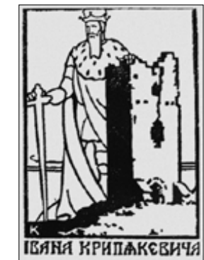
Ryc. 10. Exlibris Iwana Krypiakewycza · Fig. 10. Exlibris by Ivan Krypiakewych

na słowa uznania zasłużyli m.in. Iwan Krypiakewycz czy Wołodymyr Pańkiw. Jedno zdanie należy poświęcić postaci Wołodymyra Kubijowycza, polskiego, a następnie ukraińskiego geografę. Prowadzone przez niego badania w okresie międzywojennym oraz dorobek naukowy stawiają go na poczesnym miejscu w dziedzinie wschodniokarpackiego krajoznawstwa.