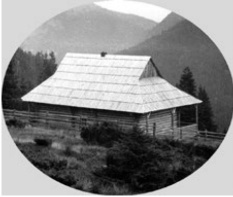
Ryc. 6. Schronisko UKTT „Płaj” na Płyścach.

Fig. 6. Tourist shelter UKTT „Płaj” on Płyśce.