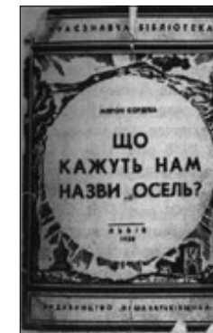
Ryc. 9. Okładka książki M. Korduby pt. Що кажуть нам назви осель? · Fig. 9. Cover of the book Що кажуть нам назви осель? by M. Korduba