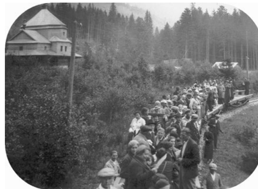
Ryc. 1. Kolejka leśna przy Skicie św. Andrzeja w Gorganach, lata 30. XX w. Fig. 1. Forest railways at St. Andrew's Skit in the Gorgans, the 1930s.

rystycznych w Karpatach w kontekście turystyki poznawczej. Dla polskiego badacza i turysty nie stanowiła ona – jak do tej pory – punktu odniesienia dla uprawiania jednej z najpopularniejszych obecnie form turystyki.