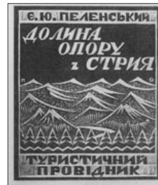
Ryc. 8. Okładka książki E.J. Pelenskiego pt. Dołyna Oporu i Stryja. Turystyczny przewodnik · Fig. 8. Cover of the book Dołyna Oporu i Stryja. Turystyczny przewodnik by E.J. Pelensky